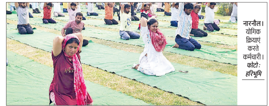
नारनौल। योगिक क्रियाएं करते कर्मचारी।

एक पृथ्वी एक स्वास्थ्य के लिए योग की थीम पर होने वाले 11वें अन्तर्राष्ट्रीय योग दिवस को लेकर सचिवालय में जिला प्रशासन महेन्द्रगढ़ की ओर से आयोजित योग प्रोटोकॉल का आयोजन किया गया। इस अवसर पर उपायुक्त डॉ. विवेक भारती मुख्य अतिथि के तौर पर मौजूद रहे। इस मौके पर सभी ने प्रोटोकॉल के तहत योगिक क्रियाएं कीं। हरियाणा योग आयोग एवं आयुष विभाग के निर्देशन में आयोजित कार्यक्रम में संबोधित करते हुए उपायुक्त ने कहा कि प्रत्येक नागरिकों को हर रोज योग