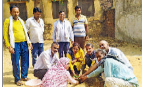
महेन्द्रगढ़। गांव बेरी में पौधरोपण करते ग्रामीण व अन्य।