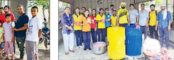
नारनौल। छबील लगाते हुए।