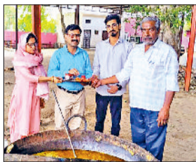
महेन्द्रगढ़। गोशाला में सवामणी लगाते परिवार के सदस्य।