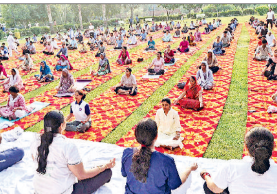
महेन्द्रगढ़। योगाभ्यास करते अधिकारी एवं कर्मचारी।

योग न केवल शारीरिक स्वास्थ्य के लिए महत्वपूर्ण है, बल्कि यह मानसिक स्वास्थ्य और तनाव प्रबंधन में भी सहायक