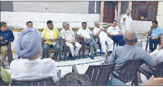
नारनौल। बैठक करते सर्वसमाज के लोग।

शहर के प्राचीनतम श्मशान घाट रेवाड़ी रोड स्थित स्वर्गाश्रम के सुधार हेतु शहर के सर्वसमाज के गणमान्य लोगों की ओर से स्वर्गाश्रम के सुंदर व व्यवस्थित संचालन हेतु एक कमेटी गठित की। वीरवार सायं शहर की 36 बिरादरी के गणमान्य लोगों की बैठक का आयोजन अग्रवाल सभा भवन प्रांगण में किया गया।