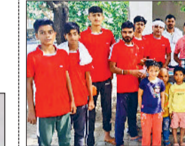
महेन्द्रगढ़। राहगीरों को पानी पिलाते हुए।

सिहमा पर लगाई गई छबील में नींबू का पानी आसपास के लोगों के अलावा वाहन चालकों ने पीया। तपती गर्मी में नींबू का पानी पीकर लोगों ने आत्मा से आशीर्षा दिया। छबील लगा रहे युवाओं का कहना है कि गर्मी के मौसम में प्यासे को