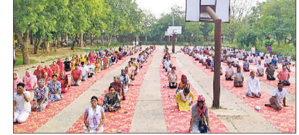
कनीना। महाविद्यालय में आयोजित योग शिविर में हिस्सा लेते कर्मचारी।