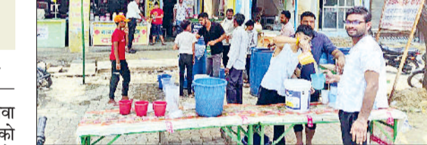
मंडी अटेली। सिहमा में छबील लगाकर नींबू पानी पिलाते युवा।

प्राणी मात्र की सेवा ही ईश्वर की सेवा है। भारतीय दर्शन के इस कथन को चरितार्थ करते हुए गांव सिहमा के युवाओं ने बढ़ती गर्मी में नींबू पानी की छबील लगाकर लोगों को पानी पिलाया। सड़क से गुजरने वाले वाहन चालकों ने युवाओं द्वारा लगाई गई नींबू की छबील में पानी पीया। इससे पहले गांव के युवा शरवत का पानी छबील लगाकर पिलाया था। नारनौल-कनीना रोड पर बस स्टैंड