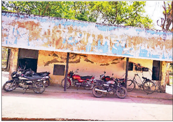
महेन्द्रगढ़। बूस्टिंग स्टेशन।

गांव देवास में जनस्वास्थ्य विभाग की ओर से नया वाटर टैंक बनाया जाएगा। वाटर टैंक का निर्माण कार्य पूरा होने के बाद शहर को काफी हद पेयजल किल्लत से राहत मिलेगी। वाटर टैंक के लिए वन विभाग की ओर से पेड़ों की कटाई की अनुमति प्रदान कर दी गई है। 17 जून को पेड़ों की नीलामी की जाएगी। नए टैंक निर्माण में करीब 14.50 करोड़ रुपये की लागत आएगी। बता दें कि महेन्द्रगढ़ शहर पूरी तरह से नहरी पानी पर निर्भर है। देवास जलघर से पानी को शहर के अलग-अलग हिस्सों में बने सात बूस्टिंग स्टेशन में भेजा जाता है। यहां से अलग-अलग कॉलोनियों में पानी आपूर्ति